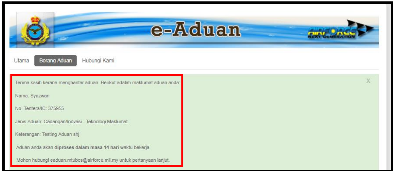
Rajah 4: Paparan borang aduan berjaya dihantar.