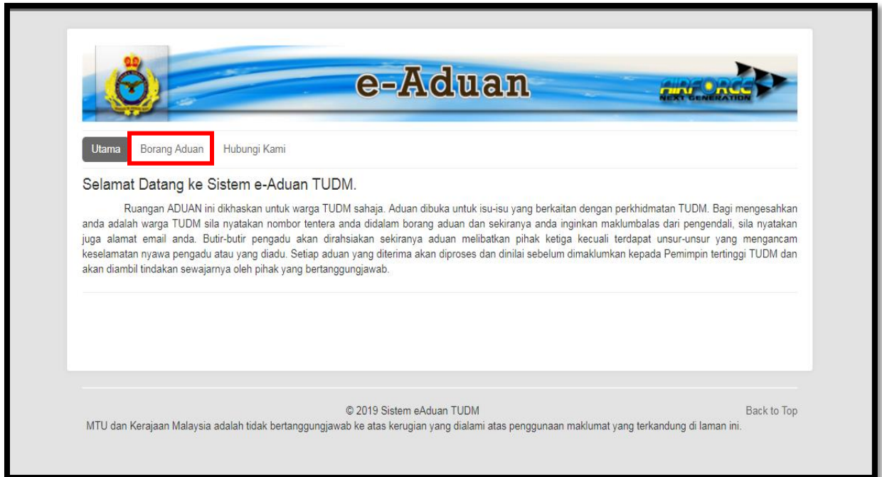
Rajah 2: Pautan ke borang aduan.